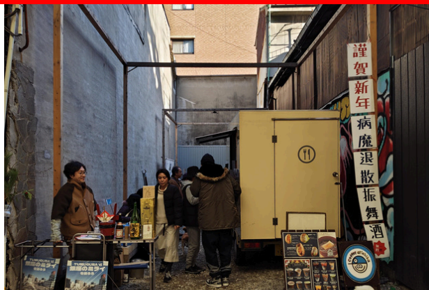
2024年1月の振る舞い酒のようす

多目的交流空地「プリンスアレイ」では『正月振舞酒 part5』も開催！真清田様の初詣の行き帰りにお寄りください。振舞酒などは無料ですが、フードリンクの持ち込み大歓迎。（カンパも大歓迎。）キッチンカー、テント調理、パフォーマンスなど飛込歓迎。 場内には、一宮市ウォーカブル事業のパネル展示（カフェウォーカブル）もあります。