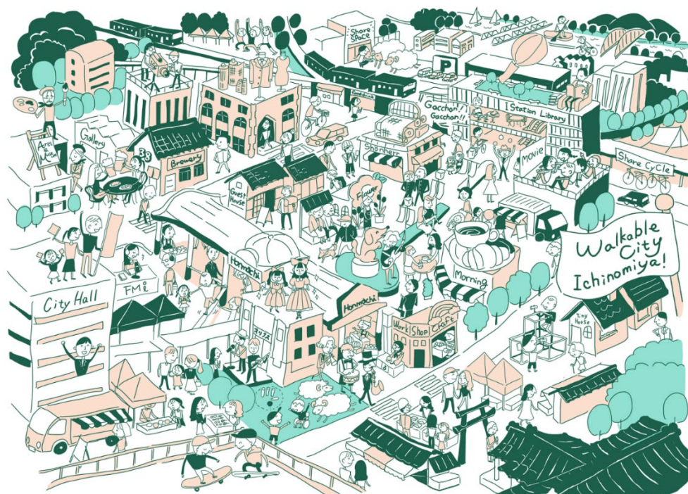
これまでの社会実験から生まれた 新しいまちなかのイメージ

人々が立ち寄りたり休んだり、のんびりできる居心地の良い環境を”まちなか”にもっと増やして、人々の滞在時間を増やして、まちなかの人通りを生みだしていける効果